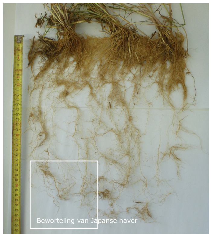
Beworteling van Japanse haver