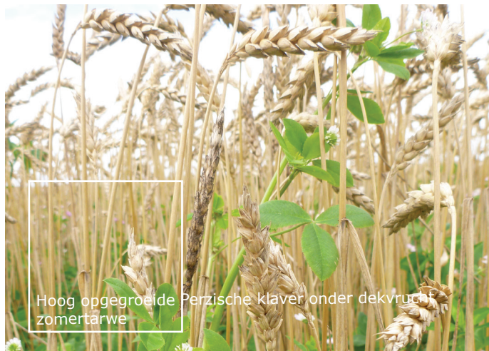
Hoog opgegroeide Perzische klaver onder dekvrucht zomertarwe

Hoewel het over het algemeen niet over grote bedragen gaat, zijn met de teelt van een groenbemester uiteraard ook kosten gemoeid. Deze betreffen vooral de zaaizaadkosten, de kosten voor een (beperkte) stikstofbemesting en de kosten voor bewerken van de groenbemester. Slechts in een enkel geval is een onkruid- of plaagbestrijding nodig. Behalve deze directe kosten vraagt een teelt uiteraard ook nog om arbeid en mechanisatie; veelal wordt dit uitgevoerd met eigen machines. Indien niet de juiste zaaimachine aanwezig is zullen ook nog loonwerkkosten voor het zaaien meegerekend moeten worden. Een aantal groenbemesters vereist een zaaitijdstip en/of een teeltperiode die in hetzelfde jaar niet te combineren is met de teelt van een cultuurgewas. Door het inzaaien van deze groenbemestingsgewassen gaan een teeltjaar en de daaruit voortvloeiende inkomsten verloren. Alleen op percelen welke meedoen in GLB kan een verlies aan inkomsten gedeeltelijk gecompenseerd worden door de premie. Meeropbrengst in volggewassen kan gedeeltelijke inkomsten (gedeeltelijk) compenseren. Zie voorbeeld Tagetes in Hoofdstuk 7. Overige groenbemesters.