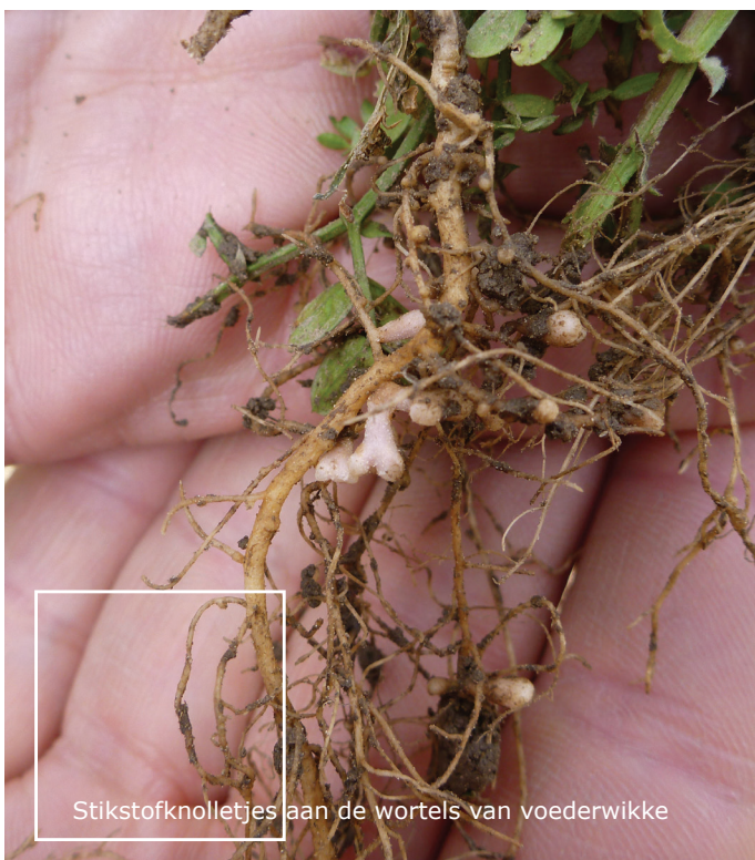
Stikstofknolletjes aan de wortels van voederwikke

Elk jaar breekt er organische stof af en wordt er nieuwe organische stof aangevoerd met gewas- en wortelresten, groenbemesters, organische mest en/of compost. Voor een duurzame bedrijfsuitvoering moet het organisch stof gehalte op peil gehouden worden door de hoeveelheid organische stof aan te voeren die jaarlijks afbreekt. Als het organische stof gehalte van de bodem laag is, is het verstandig meer organische stof aan te voeren dan er afgebroken wordt.