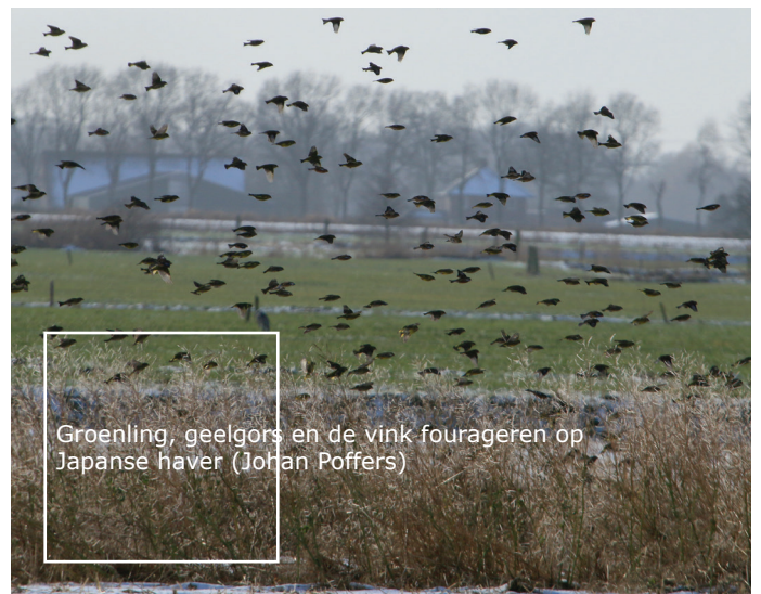
Groenling, geelgors en de vink fourageren op Japanse haver (Johan Poffers)

Groenbemers hebben vele functies, waaronder het versterken van de biodiversiteit. Ze voeden bodemleven, bovengrondse insecten en direct of indirect vogels. Indirect door de verhoogde aanwezigheid van insecten en direct door de productie van zaden. Door vroeg te zaaien, doorgaans voor 1 augustus zal er zaad gevormd worden. Dit geldt voor de meeste gangbare soorten, zoals gele mosterd, bladrammenas en Japanse haver. Enige zaadvorming is al voldoende om een waardevolle voedselbron te zijn. En dat geldt vooral als de groenbemester tot half maart blijft staan. Door het gewas wel of niet te verkleinen (meestal door klepelen) wordt er sturing gegeven aan de soort die er het meest van profiteert. Bijvoorbeeld de veldleeuwerik houdt van openheid en is daarom gebaat bij het verkleinen, de rietgors daarentegen is een echte zaadeter. Die ziet dan ook liever een onberoerd gewas (en heeft voorkeur voor Japanse haver). Een optie is banen te laten staan of juist te verkleinen, waarbij nagegaan kan worden wat waardevol is voor de voorkomende soorten in de omgeving. Soorten, zoals de kneu die op beschutte plekken leven (bos, erfsingels), maken ook gebruik van groenbemers, zolang ze maar dicht genoeg in de buurt zijn.