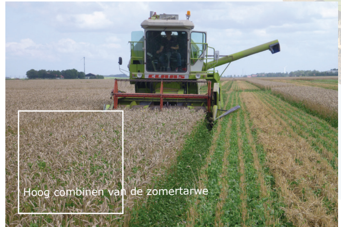
Hoog combineren van de zomertarwe

Wanneer een verkeerde groenbemester is gekozen of wanneer de dekvrucht slecht is ontwikkeld dan kan de groenbemester te hoog opgroeien in de dekvrucht. Dit kan leiden tot een opbrengstreductie van het hoofdgewas en/of problemen veroorzaken bij de oogst hiervan. Dit effect is bekend bij onder andere Italiaans raigras, rode-, Perzische en Alexandrijnse klaver. Een oplossing is dan hoog combineren onder droge omstandigheden. Voordeel daarvan is weer dat de lange stoppel een ondersteuning kan zijn voor de (vlinderbloemige) groenbemester.